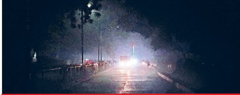
नगराणा प्रताप चौक से अनाजमंडी रोड पर छाया अंधेरा

नगर परिषद की ओर से स्ट्रीट लाइटों के मंटेनेंस का लाखों का ठेका के बाद भी शहर की कई सड़कों पर रात के समय अंधेरा छाया हुआ है। ठेका लेने वाले ठेकेदार की ओर से लाइटों की समय पर मंटेनेंस नहीं की जा रही है। शहर में स्ट्रीट लाइटों के अलावा बिजली पोल पर सौन्दर्यकरण के लिए लगाई गई तिरंगा लाइटें भी बंद पड़ी हुई हैं। शहर के सचिवालय रोड, अनाजमंडी रोड, मेन बाजार, ब्रास मार्केट, गढी बोलनी रोड, बाइपास, मिनी बाइपास व पुराने हाउसिंग बोर्ड रोड पर काफी स्ट्रीट लाइटें बंद पड़ी हुई हैं। यहां तक कि सरकुलर रोड पर बीच-बीच में काफी स्ट्रीट लाइटें खराब हो चुकी हैं। नगर परिषद कार्यालय के बाहर सड़क पर भी रात के समय अंधेरा छाया रहता है।