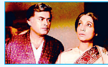
'आंधी' में सुवित्रा सेन के साथ संजीव कुमार

सुपर स्टार का ग्लैमर, हिट कराने का तमगा और स्लिम-टिम फिगर अगर किसी हीरो की इमेज को एक डेकोरम देता है, तो किसी भी भूमिका को परफेक्ट तरीके से करना भी किसी फिल्म को हिट कराने की गारंटी हो सकती है। यह बात सिद्ध की थी संजीव कुमार ने। वह एक ऐसे कलाकार थे, जिनके बारे में कहा जाता था कि वे कोई रोल निभाते नहीं, उसे पूरी तरह जीते थे। जिस तरह हिंदी फिल्म इंडस्ट्रीज में दिलीप कुमार, अमिताभ