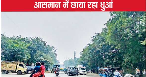
रेवाड़ी। शनिवार को शहर में छाई प्रदूषण की चादर।

की गति 8 किलोमीटर प्रति घंटा रही। अधिकतम तापमान 30.5 डिग्री व न्यूनतम तापमान 15.6 डिग्री सेल्सियस दर्ज किया गया। बीते चार दिनों से आसमान में बादल छाते रहे,