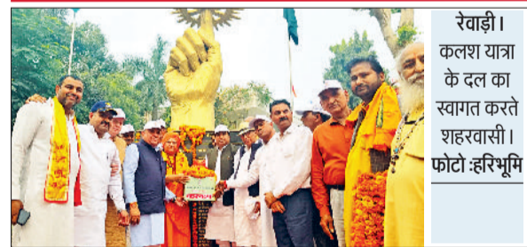
रेवाड़ी। कलश यात्रा के दल का स्वागत करते शहरवासी।