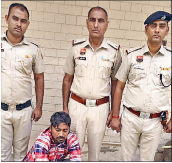
रेवाड़ी। पुलिस गिरफ्तार में जेवरात चोरी का आरोपी।