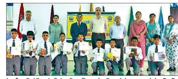
रेवाड़ी। प्रतियोगिता के विजेता विद्यार्थी प्राचार्य व शिक्षकों के साथ।

गोठड़ा अहीर स्थित सैनिक स्कूल में कनिष्ठतम समूह 'स' यानि कक्षा छठी की अंतरसदनीय अंग्रेजी कथा वाचन, वक्तृत्व कला व काव्य पाठ प्रतियोगिताओं का आयोजन किया गया, जिसमें कारगिल व रेजांगला सदन के कैडेट्स ने भाग लिया। सभी वरिष्ठ सदनों के विभाजन