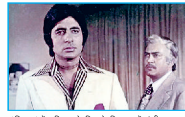
'त्रिशूल' में अमिताभ के पिता के किरदार में संजीव कुमार

दूसरे को कह देते थे-संजीव कुमार बन रहे हो? संजीव कुमार के द्वारा निभाए गए यादगार किरदारों में 'मौसम' के डॉक्टर अमरनाथ को कैसे भूला जा सकता है? इस फिल्म में उनका डबल रोल, शर्मिला टैगोर के रोल से किसी तरह से कमतर नहीं रहा। इसी तरह फिल्म 'त्रिशूल' तो अमिताभ की कही जाती है, लेकिन इसमें संजीव कुमार ने एक ऐसे व्यापारी का रोल प्ले किया, जो अंजाने में ही अपने बेटे से व्यापारिक संघर्ष कर रहा होता है और उसे पता ही नहीं चलता। इसमें पिता-पुत्र के संवाद, दो प्रतिद्वंद्वी व्यापारियों की उस लड़ाई का प्रतिनिधित्व करते हैं, जिसमें वे अपनी जीत के लिए किसी भी स्तर तक जा सकते हैं। उन पर फिल्माए गाने भी हुए हिट: संजीव कुमार पर फिल्माए गाने भी सुपरहिट रहे। 'अनोखी रात' का गीत 'ओह रे ताल मिले नदी के जल में, नदी मिले सागर में', 'खिलौना' का 'खिलौना जानकर तुम तो', 'सीता और गीता' का 'हवा के साथ-साथ, 'अनामिका' का 'मेरी भीगी सी पलकों पे', 'आंधी' का 'तुम आ गए हो, नूर आ गया है', 'मौसम' का 'दिल ढूँढता है फिर वहीं फुसंत के रात-दिन' और 'सिलसिला' का 'रंग बरसे', हर दौर के हिट गानों की श्रेणी में गिने जाते हैं। अधूरी रही प्रेम की दास्तान: संजीव कुमार ने जिस तरह से फिल्मों में अपना परचम लहराया, उसी तरह से उनके प्रेम के चर्चे भी खूब सुने जाते रहे। हेमा मालिनी के साथ के किस्से तो सर्वाधिक चर्चित रहे ही हैं। सुलक्षणा पंडित के साथ भी उनकी जोड़ी चर्चित रही पर वह भी अपने मुकाम पर पहुंचने से रह गईं। खुद के बारे में भी कई अपनी ही भविष्यवाणी को सच साबित करते हुए जीवन के पचास बसंत पूर्ण करने से पहले ही 6 नवंबर 1985 को अनंत आकाश में हमेशा-हमेशा के लिए विलीन हो गए।