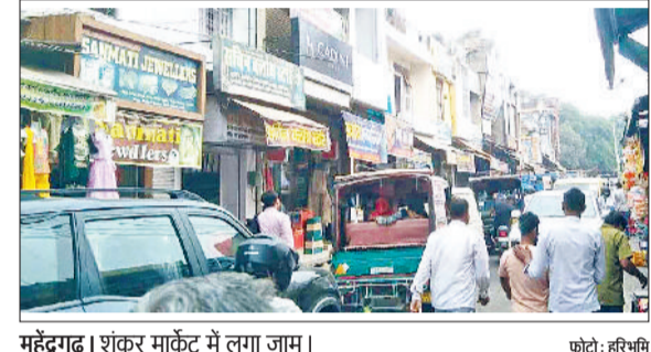
महेंद्रगढ़। शंकर मार्केट में लगा जाम।

इसके बाद भी प्रशासन द्वारा इस ओर कार्रवाई नहीं की जाती है। शहर के मुख्य बाजार और चौराहों को भी अतिक्रमण से मुक्त नहीं कराया जा रहा है। इस समय शहर का मुख्य बाजार के हालत यह है कि दिन में बाइक निकालना भी मुश्किल हो जाता है। क्योंकि दुकानें सड़क तक फैली हुई हैं, इसके बाद वहां पर अस्थाई रेहड़ी लगाने के कारण बाजारों ने गलियों का रूप ले लिया है। अतिक्रमण के कारण यहां दिन में पैदल निकलना भी मुश्किल हो जाता है। सड़क एक छोटी सी गली बनकर रह जाती है। बाजार में महिला ग्राहकों की संख्या ज्यादा रहती है। शहर के बालाजी चौक से सब्जी मंडी की ओर जाने वाले मार्ग पर हर समय जाम की समस्या रहती है। खास बात यह है कि यहां पर पुलिस कर्मी होने के बाद भी लोग जाम के झाम से जूझते हैं। यही नहीं आवाग पशु भी अक्सर यहां पर परेशानी का सबब बन जाते हैं। ऐसे में कई बार यहां पर लंबा जाम लग जाता है। जिससे लोग में प्रशासन के प्रति आक्रोश बढ़ रहा है। आसपास के रहने वालों ने बताया कि यहां पर पुलिसकर्मी