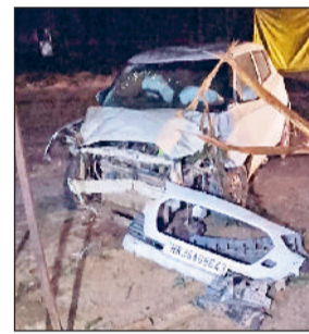
रेवाड़ी। शनिवार की रात दुर्घटनाग्रस्त हुई कार, पंचायत में ज्ञापन की प्रति दिखाते ग्रामीण।